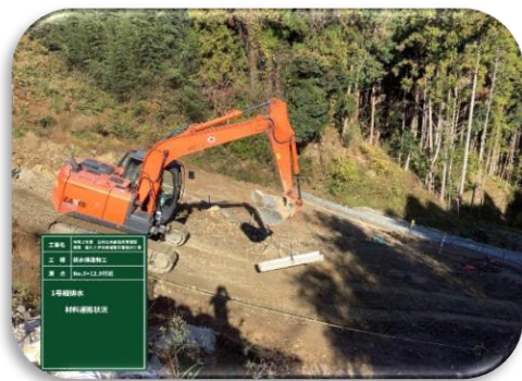
排水二次製品の運搬