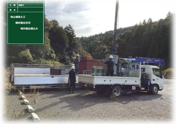
大型車両から小型車両にて積替え搬入 (仮置場)