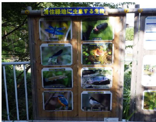
生息する生き物を紹介する看板設置