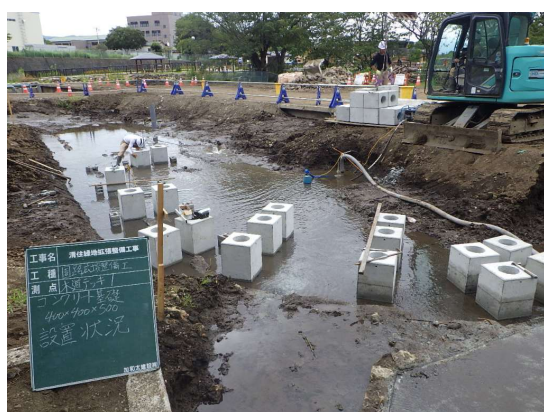
プレキャスト基礎の使用