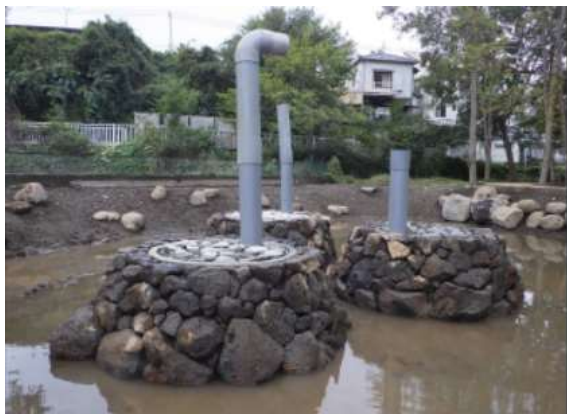
湧き間の溶岩積による修景