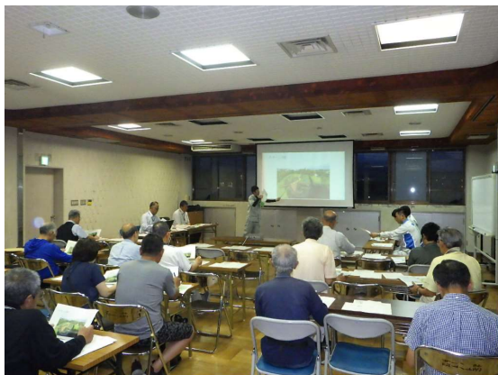
地域住民への工事説明会