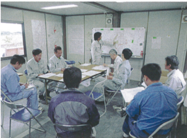
矢部地区関連工事調整会議