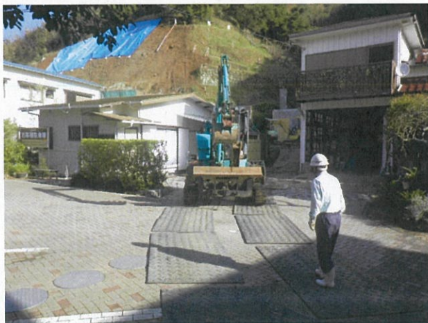
バックホウ(0.1m 3 )搬入状況